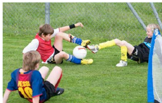
Dimensione campo: 7x 10m

Molto faticoso, inserire pause (eventualmente svolgere il gioco sotto forma di torneo).